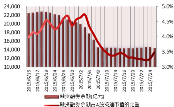
图 2：近三十个交易日融资融券余额及占 A 股流通市值的比重