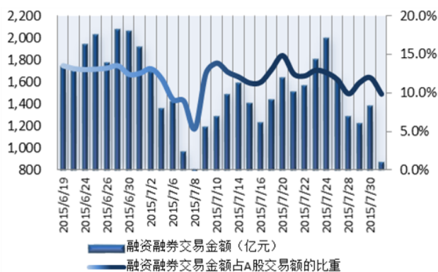
图 1: 近三十个交易日融资融券交易金额及占 A 股交易额的比重