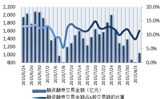
图 1: 近三十个交易日融资融券交易金额及占 A 股交易额的比重