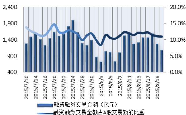
图 1: 近三十个交易日融资融券交易金额及占 A 股交易额的比重